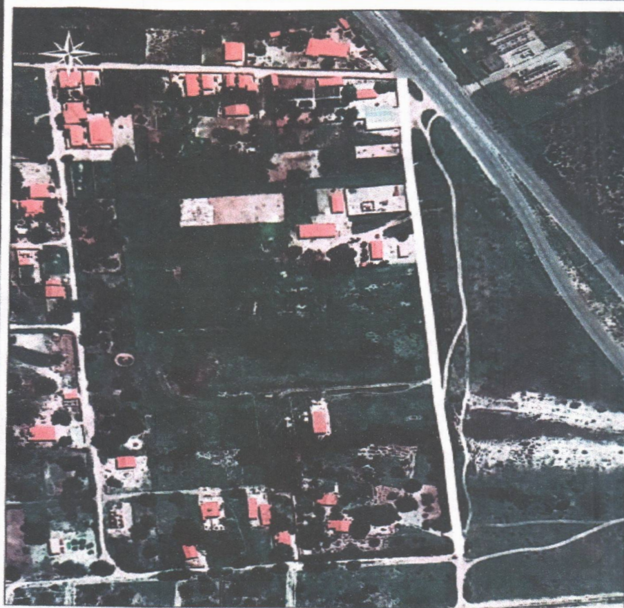
01 - CROQUI DE NOMEAÇÃO DE RUA ESC.: 1/2500