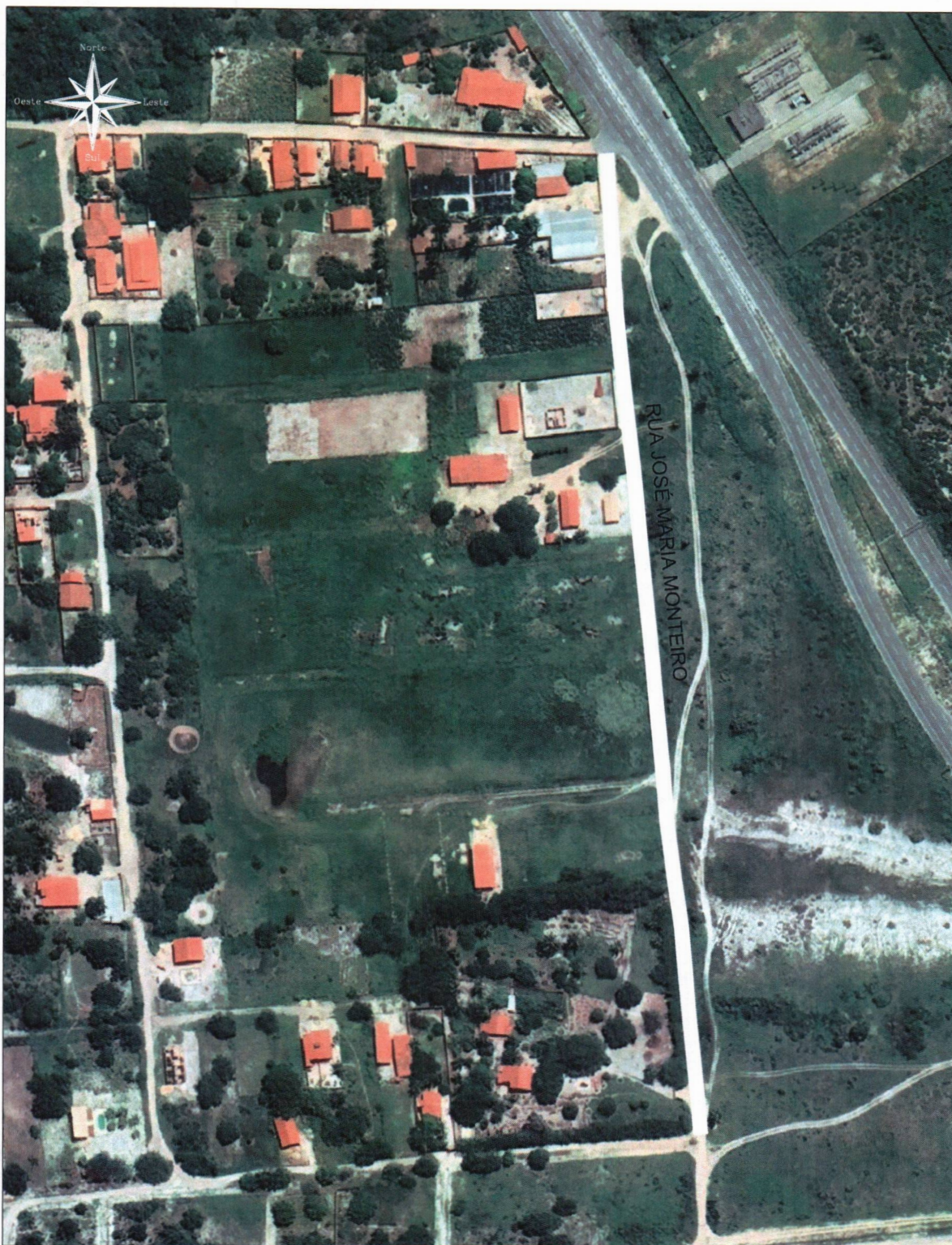
01 - CROQUI DE NOMEAÇÃO DE RUA ESC.: 1/2500